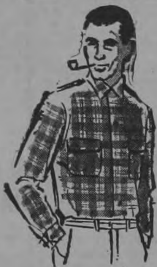
"PILGRIM" SU CAMISA SPORT C 18

...Si Ud. no tiene la ropa apropiada... Venga a SEARS por los vestidos para fiestas, con los estilos de última moda