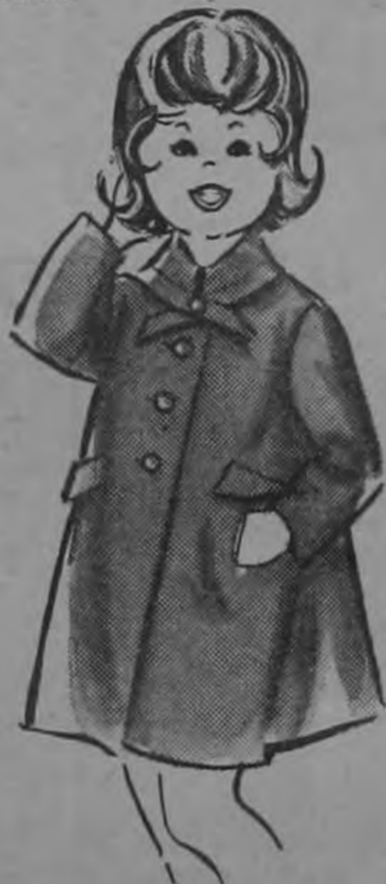
Abrigos para Niñas DESDE

En dacrón, acetato y rayón. Elegantes diseños y colores.