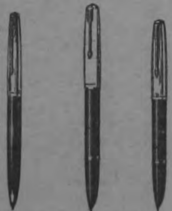
PLUMA PARKER 61 CUSTOM PLUMA PARKER "51" DORADO PLUMA PARKER SUPER "21"

Parker SUPER "21" • calidad a precio módico