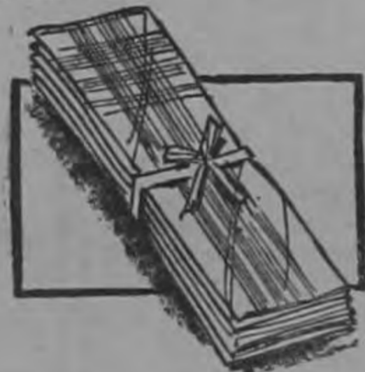
PANUELO "PILGRIM" Desde C 1,50

100% algodón - Pima. Elegantes y confortables. Todas las tallas.