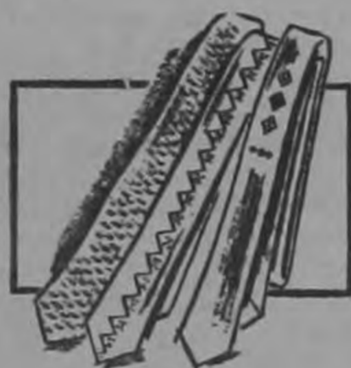
"PILGRIM", SU CORBATA PREFERIDA C 9

100% púrpura de algodón. En el surtido más completo de diseños y colores. Otra exclusividad.