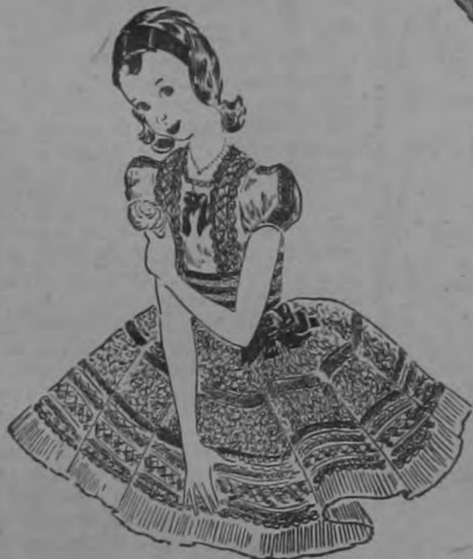
Trajes de Fiesta para Niñas

Fabricados en lanas de primera calidad y de gran moda. Variedad de estilos novedosos. Tallas de 7 a 14 años.