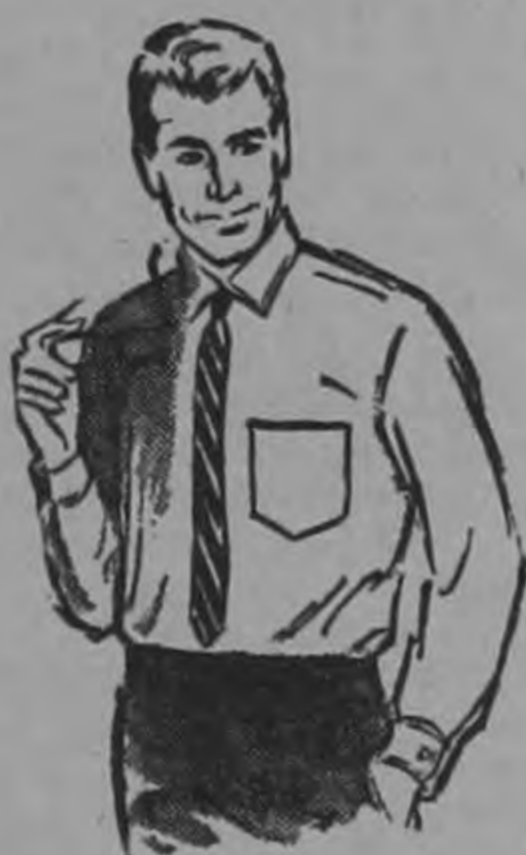
CAMISA BLANCA "PILGRIM" C 18

100% Algodón selecto. Elegantes y confortables. Con costuras reforzadas. Variedad de diseños y colores. Tallas: M - L -